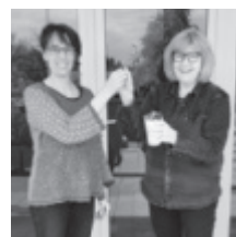
Magie und ihr Team freuen sich auf Ihren Besuch.

Jeweils am letzten Samstag im Monat ist am späten Abend geöffnet.