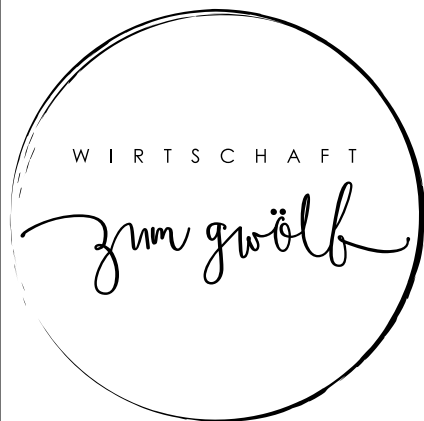
Illustration: Frank Carlson