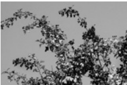
Stark befallener Weissdorn

Weitere Informationen zu Feuerbrand sind auf der Website www.feuerbrand-zh.ch zu finden.