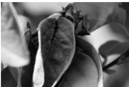
Typische Feuerbrandsymptome an Quitte Stark befallener Weissdorn